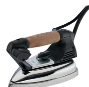
Dotazione ferro da stiro mod. EOS (fornito standard) Supplied with EOS iron (standard equipment)