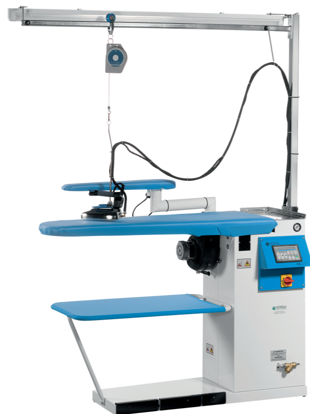
Piano di serie Standard board