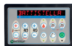
Console comandi Control panel