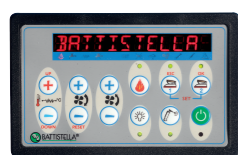
Console comandi Control panel