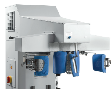
Stira tasche Pocket pressing

Touch screen standard Touch screen (standard)