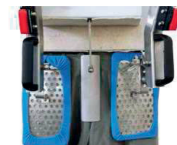
Stira pence Pleat pressing