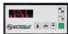
Console comandi Control panel