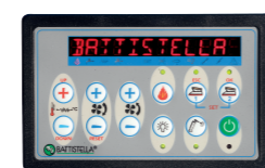
Console comandi Control panel