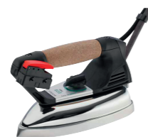
Ferro da stiro mod. EOS PRO (fornito standard) Supplied with EOS PRO iron (standard equipment)