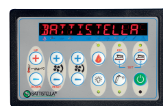
Console comandi Control panel